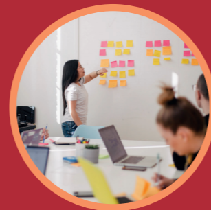
Trainingen & Scholingen