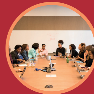
Multi Disciplinair Overleg (MDO)