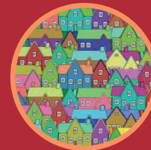
Overleg met sociaal domein / wijkgericht werken