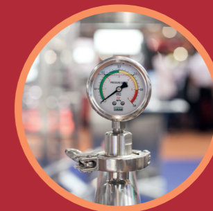
Omgaan met werkdruk